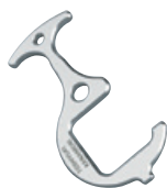
オリジナル形状チタン合金製 ドアオープナー

また付随効果として、本件の取り組みを通じて持つことができた交流を、今後のプロモーションやデザイン面で新規事業構想の一助にしていきたいと思います。