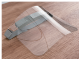
自社製フェイスシールド