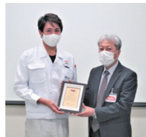
株式会社ホンダ・レーシング 取締役管理室長様(右) 来社